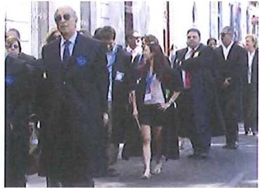
Los letrados recorrieron el centro de Madrid con la toga en señal de protesta.