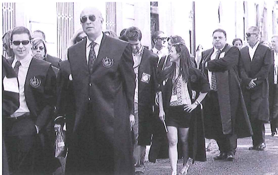
Cientos de abogados de todo el Estado se manifestaron ayer en Madrid por la Justicia gratuita.