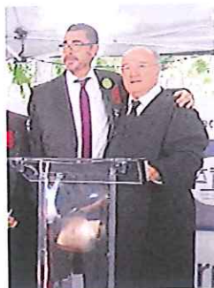
Nogueira y Carnicer, ayer en Madrid

La Abogacía Española reclamó una negociación abierta y urgente de este y otros proyectos normativos que afectan a los derechos de los ciudadanos.