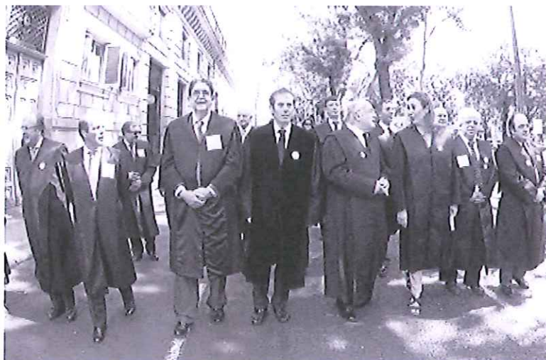
Los abogados recorrieron en su manifestación un tramo del paseo madrileño de Recoletos