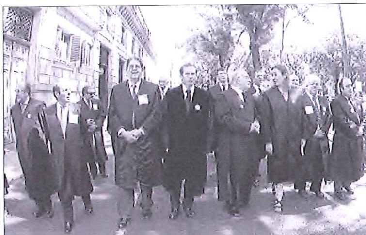
Un millar de letrados marcharon vestidos con togas por el Paseo de Recoletos de Madrid.