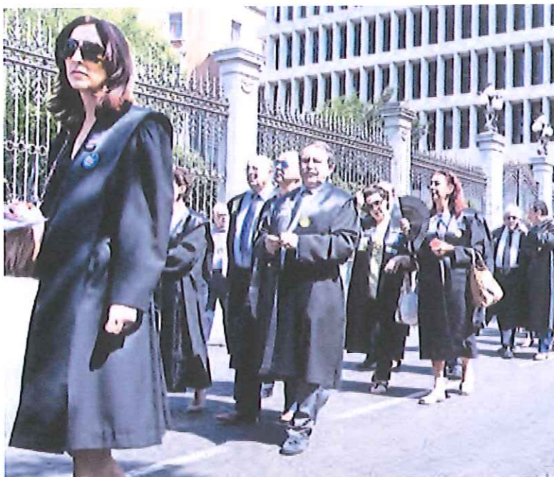
Los abogados se manifiestan en el madrileño paseo de Recoletos.