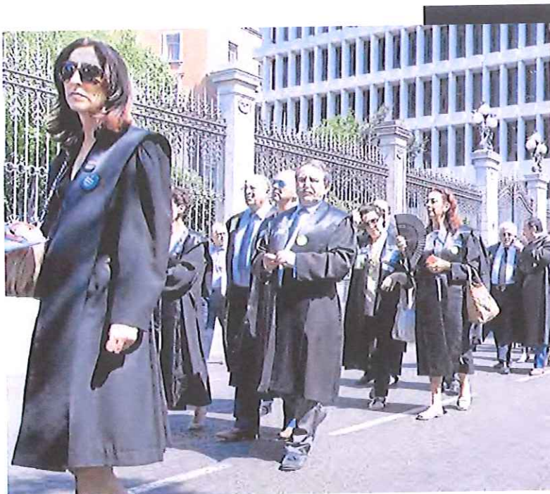
Los abogados se manifiestan en el madrileño paseo de Recoletos.