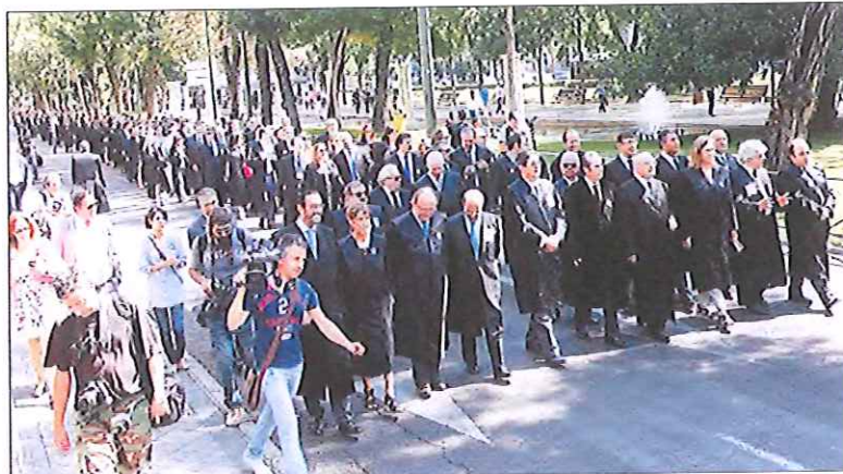
El presidente del Consejo de la Abogacía encabezó la protesta de los decanos en defensa de la Justicia gratuita.