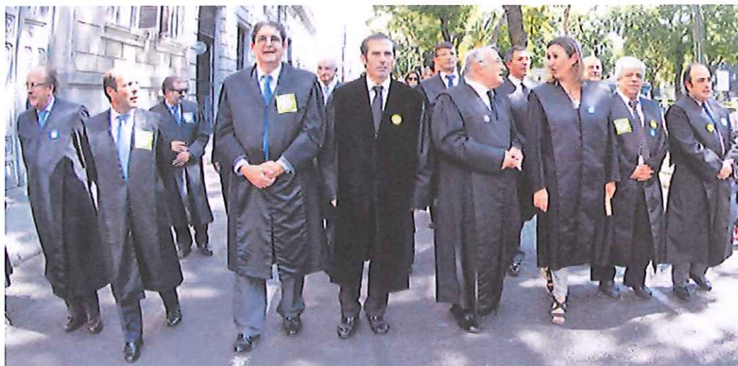
Cerca de 700 abogados se manifestaron vestidos con toga en Madrid para expresar su rechazo al proyecto de ley de justicia gratuita.