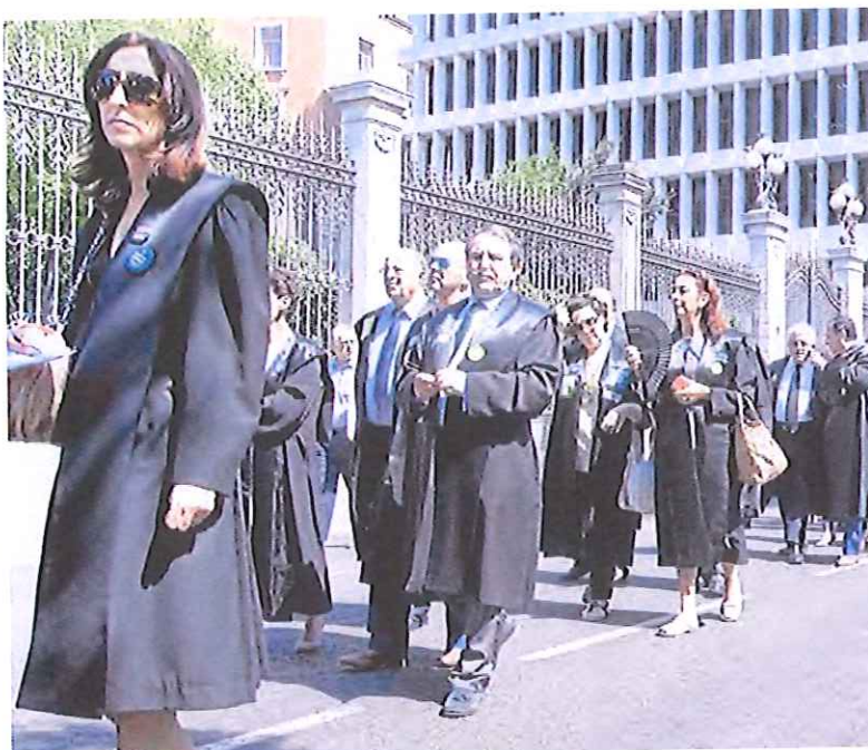
Los abogados se manifiestan en el madrileño paseo de Recoletos.