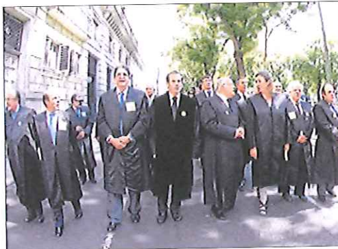
Abogados, ayer marchando por Madrid.

■ Cerca de un millar de abogados, encabezados por los decanos y las juntas de gobierno de los 83 Colegios de Abogados de toda España, se manifestaron ayer vestidos con toga en Madrid para expresar su rechazo al proyecto de ley de justicia gratuita, que consideran que solo causará perjuicios a los ciudadanos. Al término de la protesta, el presidente del Consejo General de la Abogacía Española,