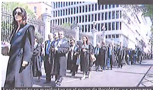
Los abogados se manifiestan en el paseo de Recoletos.

:: M.S.P. Una marea de togas negras salió ayer a la calle en Madrid para defender el trabajo de los abogados de oficio. Cerca de 700 letrados de los 83 colegios de España, vestidos con su 'ropa de trabajo', se manifestaron en el corazón de la capital en contra del proyecto de ley de justicia gratuita.