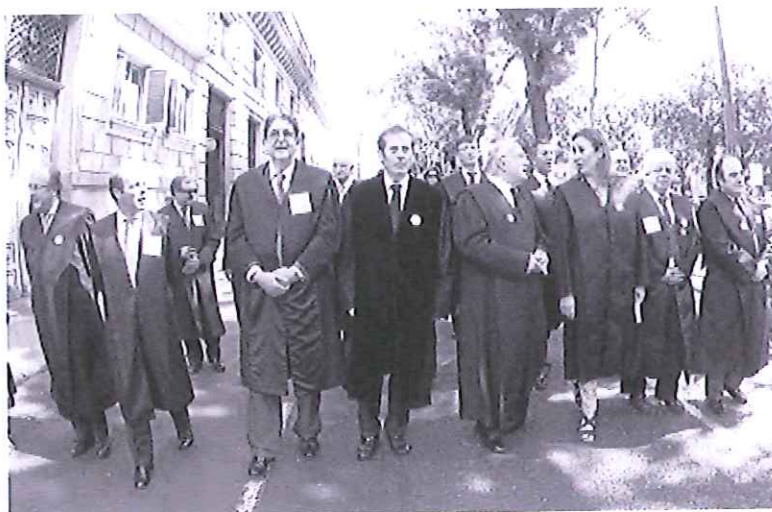
Los abogados recorrieron en su manifestación un tramo del paseo madrileño de Recoletos