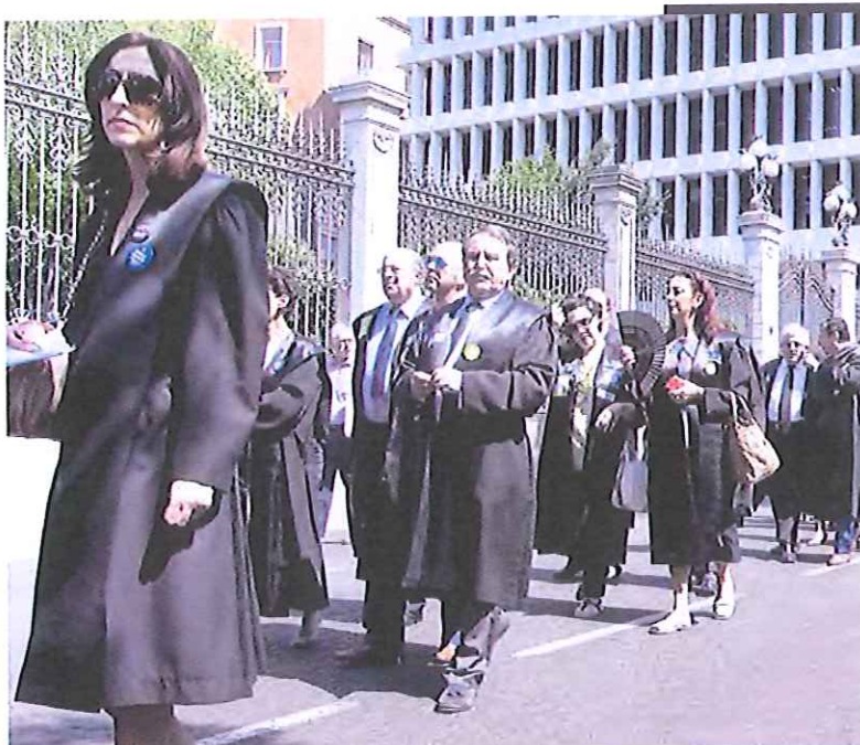
Los abogados se manifiestan en el madrileño paseo de Recoletos.