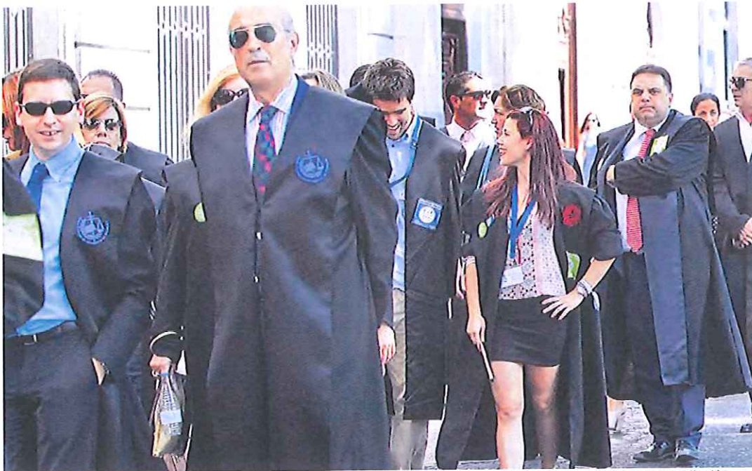
Abogados de todas las provincias españolas se desplazaron ayer a Madrid para manifestarse contra la reforma del ministro Ruiz-Gallardón.