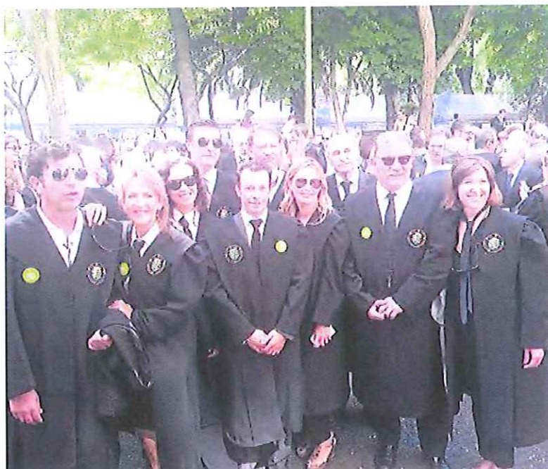
Abogados del colegio de Granada, durante la manifestación de ayer en Madrid.