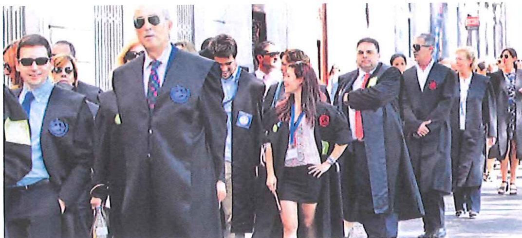
Abogados de todas las provincias españolas manifestaron ayer en Madrid contra la reforma del ministro Ruiz-Gallardón.