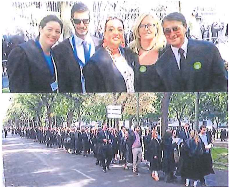
Arriba, parte de la delegación del ICACE; sobre estas líneas, abogados de toda España, ayer en la protesta. CEEDECA

Los cerca de 1.000 participantes, vestidos con toga, salieron de la sede de la Abogacía, en el Paseo de Recoletos 13, continuaron hasta la Plaza de Cibeles para llegar hasta el bulvar central en el que se había instalado una carpa que permaneció abierta a los ciudadanos y abogados