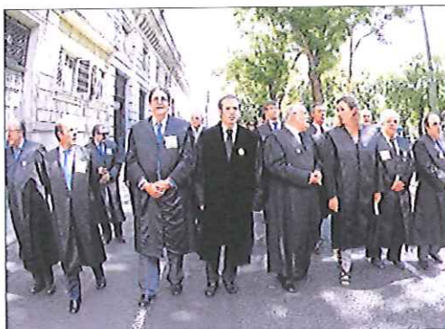
Abogados, ayer marchando por Madrid.

■ Cerca de un millar de abogados, encabezados por los decanos y las juntas de gobierno de los 83 Colegios de Abogados de toda España, se manifestaron ayer vestidos con toga en Madrid para expresar su rechazo al proyecto de ley de justicia gratuita, que consideran que solo causará perjuicios a los ciudadanos. Al término de la protesta, el presidente del Consejo General de la Abogacía Española,