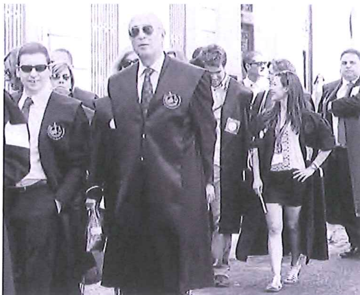
Cientos de abogados de todo el Estado se manifestaron ayer en Madrid por la Justicia gratuita.