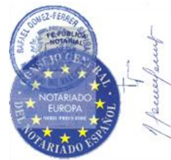
Mensaje de confirmación