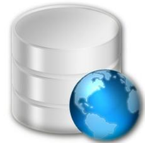
Repositorio de evidencias