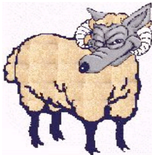
sense ús legítim