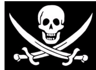
registrada i usada de mala fe