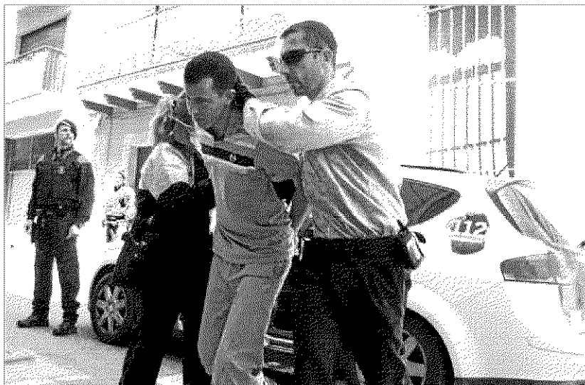
Un detingut, acusat d'assalts violents a cases del Baix Empordà és conduït als jutjats, el maig passat

Pel que fa al dret a la informació del detingut, l'advocat i membre de la comissió normati-